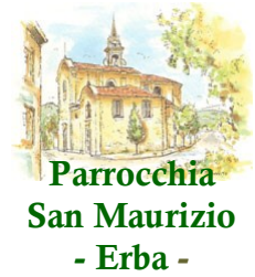
Parrocchia San Maurizio - Erba -